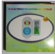
Un contrôleur + Télécommande